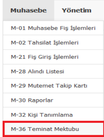
ŞEKİL 1 MUHASEBE MENÜSÜ - M-36 TEMİNAT MEKTUBU

Veznedar rolündeki kullanıcı sistemdeki teminat mektuplarını görmek için “Muhasebe” menüsü altında bulunan “M-36 Teminat Mektubu” alt menüsüne tıklamalıdır.