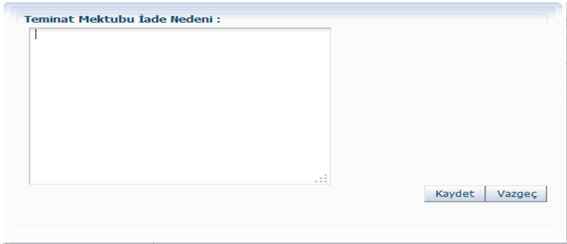
ŞEKİL 8 M-36 TEMİNAT MEKTUBU İADE NEDENİ POPUP

Kullanıcı teminat mektubunu iade etmek isterse ilgili teminat mektubu listeden seçerek İade Et butonuna tıklar. Bu butona tıkladıktan sonra aşağıdaki iade nedeni popup ekranı açılır.